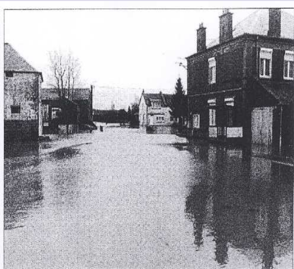
Grand-Fayt avait des allures de petite Venise, sans les gondoles... Plus de 60 mm de pluies sont tombées sur l'Avesnois depuis vendredi dernier.